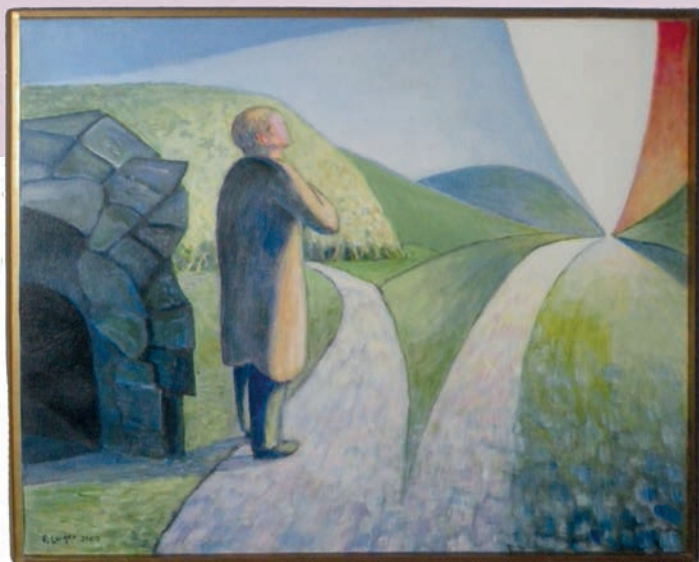
"De två vägarna"

Pauls målningar framställer också människas villkor i tiden och i evigheten. På en av dem ser man öppningen till en boning i något som liknar en jordkula och strax intill ligger en avlagd rock.