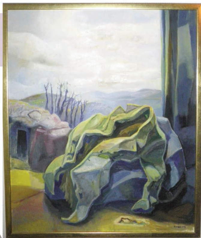
"Den avlagda klädanden"

andliga hem. Men missionsförsamlingen i Ruda har upphört och i Missionskyrkan i Högsby är verksamheten mycket begränsad numera. Jag deltar