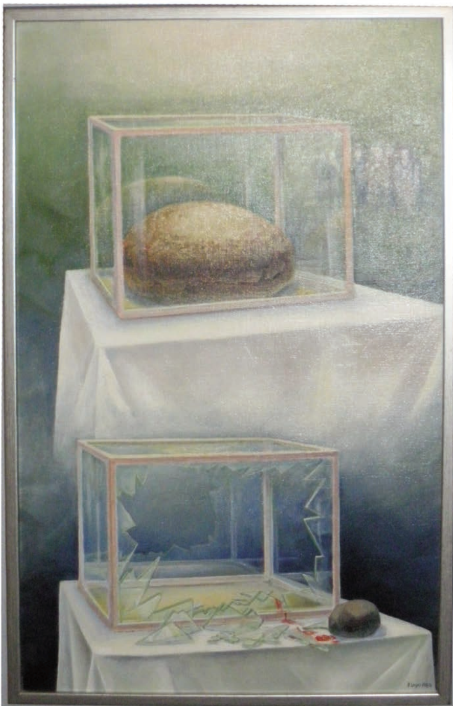
"Den fattiga och den rika delen av världen"

Paul visar också välgjorda etsningar, sådana som vi brukar kalla kopparstick, också de med motiv från det vi kallar frälsningshistorien. På den ena ser man Kristi korsvandring och på den andra själva korsfästelsen.